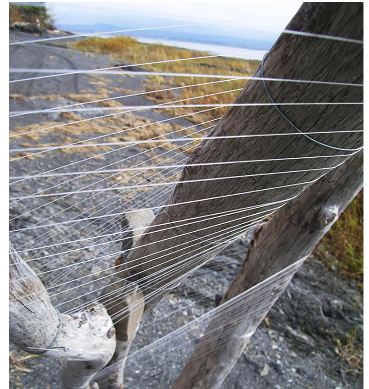
Bois flotté - fil de fer - pierres